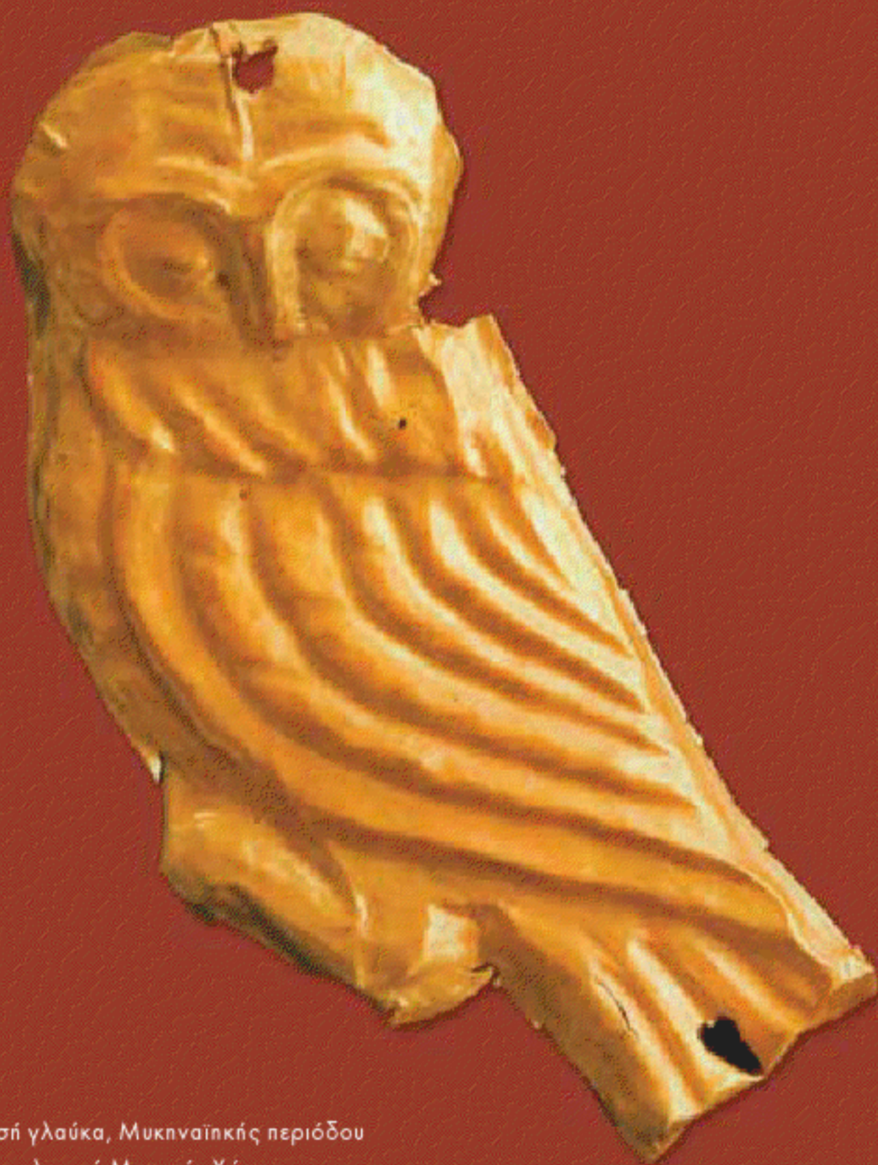
Χρυσή γλαύκα, Μυκηναϊκής περιόδου Αρχαιολογικό Μουσείο Χώρας